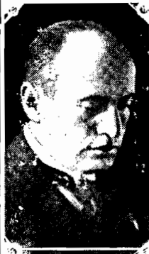
O sr. Mussolini, chefe de governo italiano