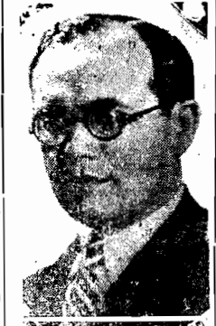
O sr. José Américo

RIO, (via aérea) — Sollicitado pela A Noite, o sr. José Américo de Almeida, que regressou de Belo Horizonte, onde inaugurou a campanha de sua candidatura á presidên-