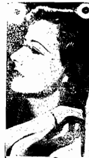
Irene Dunne, 19

É um filme que não pode ser descrito, é pre- ciso ser assistido!