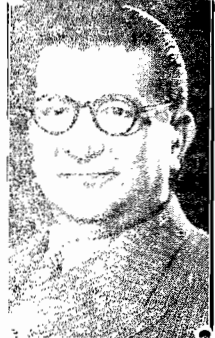
O senador Artur Costa

O sr. Governador do Estado recebeu o seguinte telegrama: CURITIBA, 9 — A polícia civil do Estado do Paraná, honrada com a visita do excmo. sr. dr. Claribalde Galvão, Secretário da Segurança desse Estado, ofereceu a hoje um banquete ao referido auxiliar do governo de vossacena, realizado no restaurante Doppelvavor, às dezenove horas. Compareceram todas as altas autoridades policiais. Otacendo a homenagem tive ocasião de saudar o ilustre Secretário em nome da polícia civil e ao mesmo tempo, em nome do governador: Manoel Ribas, levantando um brinde à prosperidade deste grande Estado, cujos limites geográficos delineados não encerravam fronteiras de cordialidade, admiração e estima dos dois Estados, fazendo votos pela felicidade pessoal de vossa excelência e ao governo. O dr. Claribalde, agradecendo em brilhante discurso, retribuía as saudações, levantando um brinde ao governador do Paraná e ao Estado em nome de vossacena. Transmitindo referida homenagem demonstrei a vossacena tanto a impressão deixada pelo Secretário da Segurança como o grande apreço que merecem o nome de vossacena e do povo do Estado de Santa Catarina. Saudações. Roberto Barroso, Chefe de Polícia.