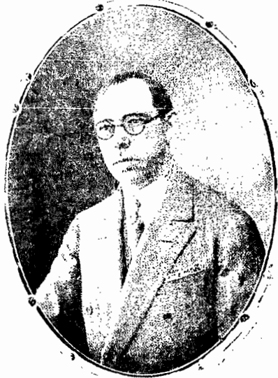
O sr. Governador Nereu Ramos

Inicie-se hoje o tráfego desta linha postal. Florianópolis e Laguna, estabelecidas, assim, a Diretoria Regional dos Correios e Telégrafos.