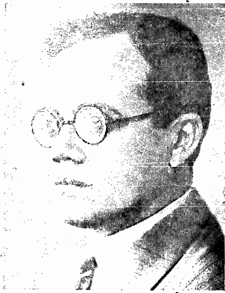
O. Sr. José Americo de Almeida