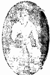
Adolfo L. Lodwig

residente em Brusque, contemplado com o premio maior no valor de Rs. 5:175$000