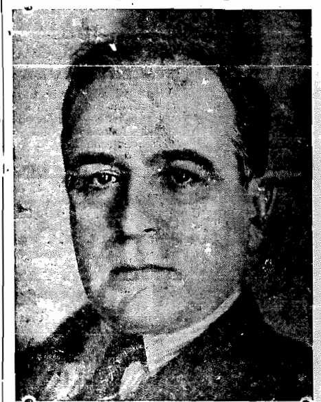
país, — condição sem a qual os nossos títulos nos mercados mundiais, já não poderiam alcançar a invejá-

Si, sob a apreciação econômico-financeira, é de animadora confiança a atualidade governativa do