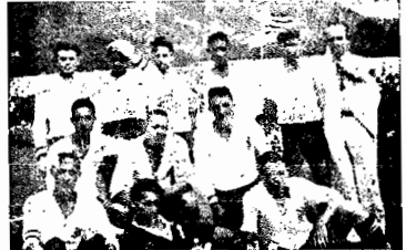
o Figueirense, que pretende atravessar invicto o campeonato deste ano