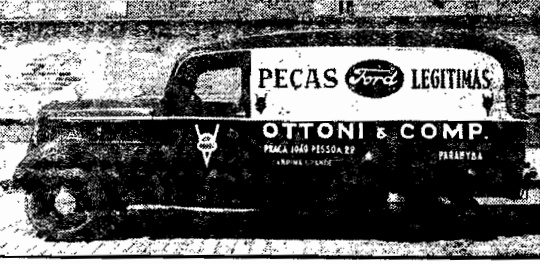
O carro distribuidor de peças Ford legittimas, propriedade dos Agentes Ottoni & Cia., instalado num moderno V-8 de 60 cavalos

O carro distribuidor de peças Ford legittimas, dos Agentes Ford Ottoni & Cia., recentemente inaugurado em Campina Grande, ao mesmo tempo que indica o promissor desenvolvimento do automobilismo no progressista Estado nordestino, confirma o tradicional criterio