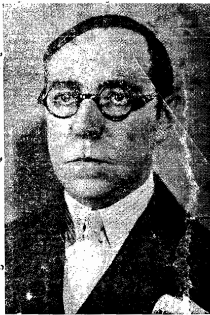
Dr. Neréu Ramos, Governador do Estado