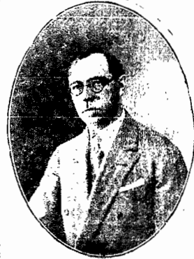
O sr. Governador Nerêu Ramos

A Governar forte, sim, porque as diretrizes de confiança são amplo livro aberto, na reconquista diuturna de confiança coletiva; governo forte, sim, a que sabe se desdobrar, venodo-ramente, no dinamismo da mais completa plataforma administrativa de que houve notícia em nossa terra; governo forte, e de homens de bem, sim, porque, si na materialidade de suas amplas realizações, se sente o «resuraxim!» das nossas possibilidades econômicas, no campo moral, então, sua autoridade é tamanha que não dispõe de tempo a perder com críticas mesóvolas e inconsequentes dos eternos heróis de mármore de café.