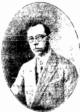
O sr. dr. Neréu Ramos

Como se vê do tele-rama que abaixo transcrevemos, suscitado por pessoas de grande e inquestionável influência política e dirigido em data de ontem ao Governador Neréu Ramos, illustre Presidente do Partido Liberal Catarinense, cada vez mais se revigora e aprofunda na consciência cívica do eleitorado catarinense e mais particularmente do Sul do Estado, as raízes da pujante agremiação partidária que é hoje a sementeira avançada do regime.