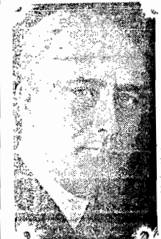
O sr. Roosevelt

WASHINGTON, (via aérea) — Em discurso que pronunciou pelo radio, o presidente Roosevelt criticou a Córte Suprema por ter retardado o progresso social e economico do país com a invalidação das leis do New Deal. Pediu ao Congresso que tomasse desde já em consideração sua proposta de reforma judicial, a qual permite a apensadouria, de todos os juizes federais, inclusive os da Corte Suprema. O projeto outorga ao presidente o poder de nomear juiz suplente para qualquer tribunal, desde que um juiz efetivo que tenha completado 70 anos de idade não peça aposentadoria no prazo de seis meses.