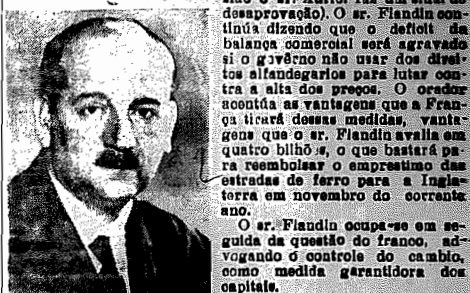
O sr. Etienne Flandin

PARIS, (via aérea) — O sr. Pierre Flandin firmou na Câmara que a alta continua dos preços levará o governo fatalmente a revisão dos contratos e fornecimentos, aumentando também os vencimentos dos funcionários. Acentua-se que este alta absorve ou produzirá o capital. O sr. Flandin assegura que o governo discorda, dentro de breve, pedir novos créditos ao Banco de França (nesta ocasião o sr. Auréli fez um sinal de desaprovção). O sr. Flandin continua dizendo que o déficit da balança comercial será agravado se o governo não usar dos dispositivos alfandegários para lutar contra a alta dos preços. O orador acentua as vantagens que a França tirará dessas medidas, vantagens que o sr. Flandin avalia em quatro bilhões, o que bastará para reembolsar o empréstimo das estradas de ferro para a Inglaterra em novembro do corrente ano.