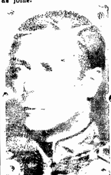
Duque de Windsor

Eduardo de Windsor mostra-se contrariado e irritado diante do pedido feito pela família no sentido de serem devolvidas as joias.