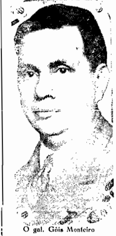
O gal. Góis Monteiro

RIO, (via aérea) — Informações oficiais dizem que o general Góis Monteiro chegou a Curitiba em avião do Exer-