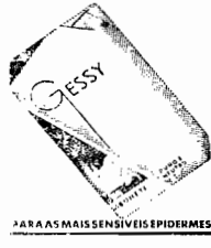
PARA AS MAIS SENSIVEIS EPIDERMES

Usado minutos por dia, o sabonete Gessy diminui annos na idade da culis. Composto de oleos vegetaes seleccionados, produz uma espuma suave e perfumada, que limpa e revitaliza a epiderme.