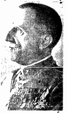
Vitor Emanuel III coroação do rei da Inglaterra a 9 de maio. Real da Itália não se fará representar, foi a decisão

LONDRES, (via aérea) — Se o ex-Imperador da Etiópia Haile Selassié assistirá às festas de