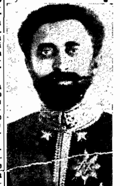
Haile Selassie foi reconhecida, é difícil renunciar aos preceitos da cortesia ordinária.

se queira criar um incidente anglo-italiano. Acrescenta-se que, enquanto a conquista não