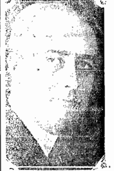
O presidente Roosevelt

WASHINGTON, (via aérea) - O presidente Roosevelt enviou ao Congresso uma mensagem instando no sentido de