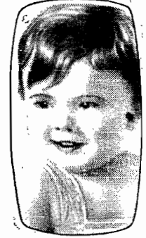
PARA AS MAIS SENSIVEIS EPIDERMES

Gessy UM SABONETE PURO ENEUTRO Contendo purissimos óleos vegetaes, o Sabonete Gessy constitui o tratamento ideal para as mais sensiveis epidermes! De longa duração, penetra em todos os poros, limpando, revitaliza e perfuma!