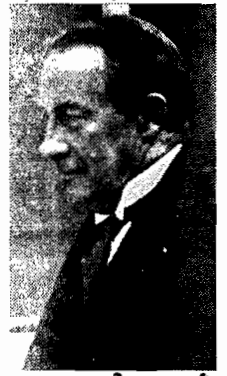
O sr. Stanley Baldwin

LONDRES, (via aérea) - Volta-se a falar nos círculos políticos na hipótese do senhor Stanley Baldwin deixar as funções de chefe do governo. Os