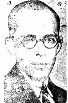
O ministro Gustavo Capanema

pelo Conselho. Este tem o prazo de três meses para realização dessa importante tarefa, fundamental aos destinos da educação nacional.