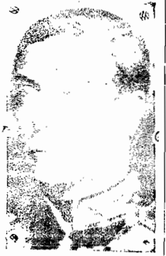
O Duque de Windsor

ceza é membro da familia Rotchild já teria sido convidado. Depois do casamento, o duque de Windsor irá morar em Wiesbaden, na Alemanha, e não em Munich, como se noticiou.