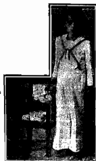
Acacio Cardoso, residente em São dos Limões, contemplado com o premio maior no valor de 5.175$000 no sorteio de 4-2-36