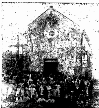
Igreja de Nossa Senhora da Fiedade contemplada com o premio maior, no valor de 5.175$000 em sorteio de 18/7/1936.