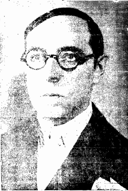
O sr. Nerêu Ramos