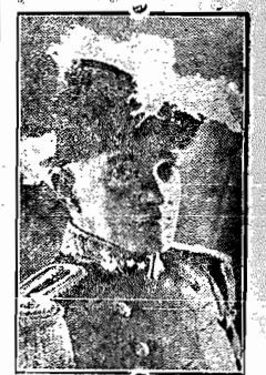
Almirante Protógenes Guimarães

RIO, (via aérea) — A fim de avistar com o governador, flu-