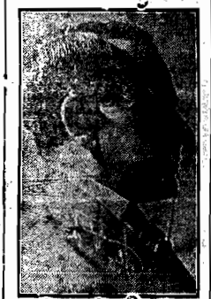
O sr. Getúlio Vargas

RIO, (via aérea) — No Palácio Rio Negro, em Petropolis, esteve em visita, ontem à tarde, ao Chefe da Nação, o