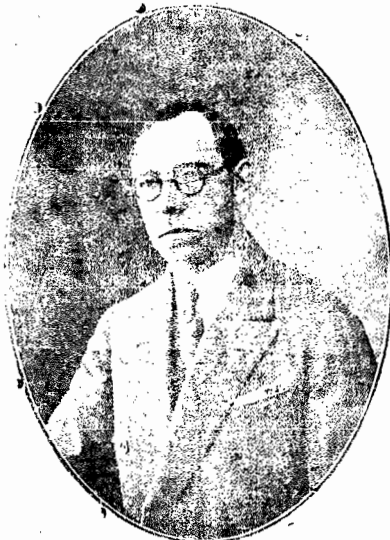
O sr. Nerêu Ramos

Da Penitenciária, os srs. governadores da Bahia e de Minas Gerais dirigiram-se ao Horto Florestal, visitando as principais dependências desse departamento subordinado à Secretaria da Agricultura.