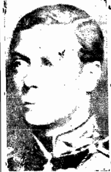
O duque de Windsor

VIENA, (via aérea) — O duque de Windsor, está para receber por estes dias a visita de sua irmã, a princesa Maria, segundo o New Wiener Zeitung , que acrescenta ter o duque de Kent expressado o desejo de visitar seu irmão, quando voltou das comemorações do casamento da princesa Juliana, mas o governo britânico não achou conveniente esta visita ao antigo rei. Afirma-