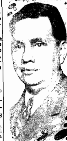
O gal. Góis Monteiro

SÃO PAULO, (via aérea) — O general Góis Monteiro partiu de avião, com o seu estado-