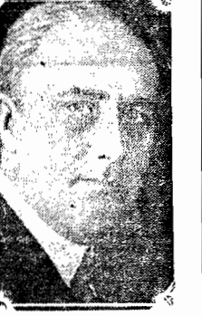
Sr. Franklin D. Roosevelt

te o seu generoso telegrama, por ocasião da minha posse. Lembro-me com grande satisfação da sua hospitalidade durante minha visita ao Rio e da calorosa recepção que nesse ensejo recebi do seu povo. Foi para mim um verdadeiro privilégio hospedar aqui o dr. Macedo Soares e receber por seu intermédio as mensagens de v. ex. Tenho o prazer de aproveitar esta oportunidade para formular os