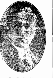
Sr. Getúlio Vargas

RIO, (via aérea) — Entre o chefe da nação e o sr. Franklin Roosevelt, foram trocadas os seguintes telegramas, por ocasião da posse do pre-