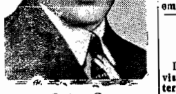
O sr. Gustavo Capanema

RIO, (via aérea) — Está despertando vivo interesse a próxima conferência do professor Antonio Sá Pereira, que acaba de chegar da Europa, onde foi comissionado pelo Ministerio da Educação, para estudar questões de educação e cultura. De volta, o ministro Gustavo Capanema, con-