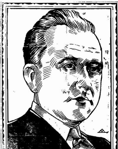
Dr. Getúlio Vargas

O sr. Getúlio Vargas visitou a Comissão de Finanças da Câmara, fazendo declarações