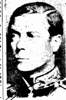
O Duque de Windsor esperado amanhã ou depois em Entsefeld, onde visitará o seu irmão, o duque de Windsor.

HAIÁ, (via aérea) — O duque de Kent, que assistiu ao casamento da princesa Juliana, é