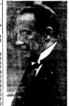
O sr. Stanley Baldwin

Baldwin, sobre as próximas medidas a tomar. As respostas do Reich e da Itália formarão a base dos futuros estudos do problema. O controle proposto pelo Reich será efetuado com particular atenção.