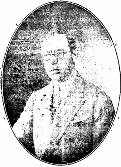
O Governador Nerêu Ramos

RIO, 8 — Pelo avião de carreira da «Condor» chegou, ontem, o governador Nerêu Ramos.