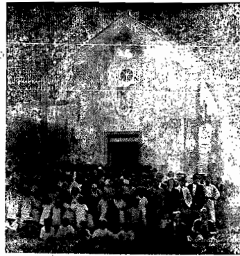
Igreja de Nossa Senhora da Piedade contemplada com o premio maior, no valor de 15:78000 em sorteio de 18:7:1936