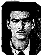
Caroco, o melhor esquerdo da Serra

manfino, Galego, Aquino, Vadio e outros mais