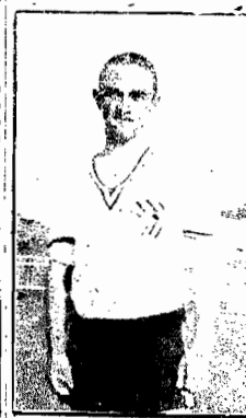
CALICO, que disputará á Caná qual o melhor extremo esquerda catarinense