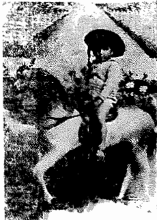
João I deute q do con valor