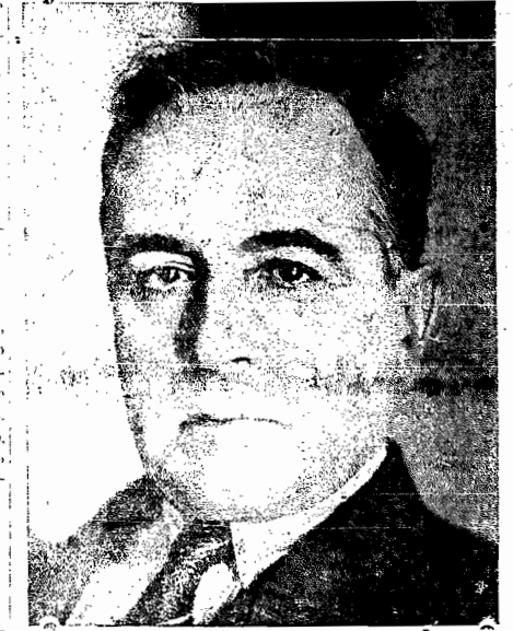
O sr. Getúlio Vargas, Presidente da República