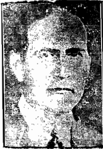
O sr. Osvaldo Aranha

PORTO ALEGRE, 30 (via aérea). Colheços, aqui em finais bem informados, a notícia de que está definitivamente assentado o regresso em janeiro próximo, do sr. Osvaldo Aranha, ao Brasil. Nessa ocasião o sr. Osvaldo