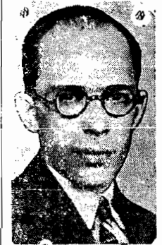
O sr. Gustavo Capanema

RIO, 1 (via aérea) — Ao Sr. Gustavo Capanema, Minis-