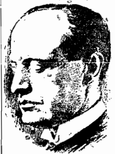
O sr. Mussolini

O nome de Guidonia foi motivado pelo fato de seus habitantes se dedicarem inteiramente à aviação.