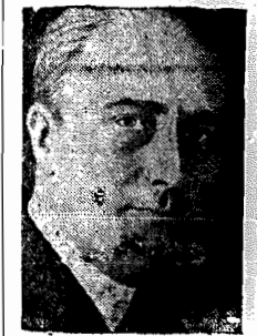
O sr. Roosevelt

WASHINGTON, 1 (via aérea) — O presidente Roosevelt recebeu em Hyde Park, os