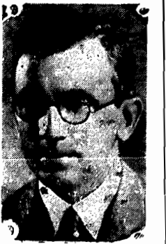
Os seus efusivos votos de felicidades.