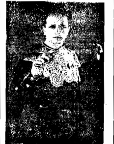
Tenor Abele de Angelis

Está, portanto, dade já assegurado um exito de grande classe para a estreia, em que o mais fino elemento social da capital, terá consólio ampla para assistir uma brilhante temporada de arte lírica.