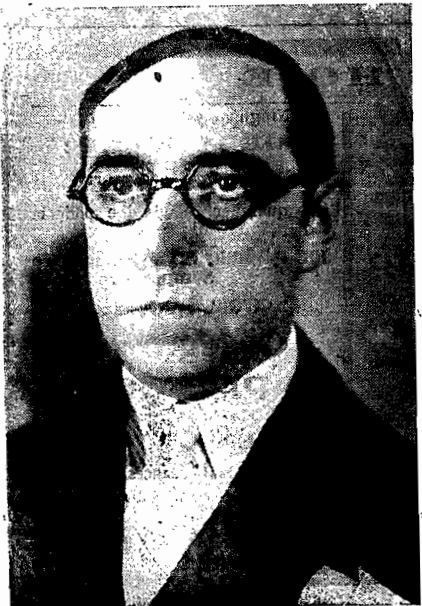
O sr. Governador Nerú Ramos

RIO, 24 (República) -- O Congresso Rodoviário acaba de aprovar, em plenário, por proposta do engenheiro Gumerindo Penteado, delegado de São Paulo, uma moção de louvor ao Estado de Santa Catarina e ao Governo desse mesmo Estado, pela organização e apresentação dos trabalhos que figuram naquele Congresso e pelo particular interesse que o Governo Catarinense tem demonstrado pelos serviços rodoviários. Essa significativa distinção foi conferida unicamente ao Estado de Santa Catarina.