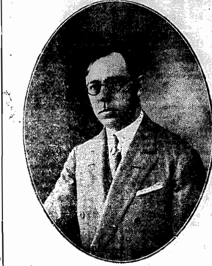
O Governador Nereu Ramos

Hoje, anda feito costume designar-se do direito, e chega a incógnita dos destruidores a atribuir ao direito os males que presenciamos pelo mundo afora, e que, com indistinta espanto, vemos que amea-