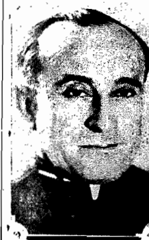
Conego Olimpio de Melo

RIO, (via aérea) — Ao conego Olimpio de Melo, hoje, será oferecido um almoço pelos representantes do Distrito Federal na Câmara Municipal. O agaspe terá um caráter essencialmente político, de apoio à orientação que o prefeito interino vem imprimindo aos destinos da administração municipal. O almoço, que se realizará no Restaurante Lido, será presidido pelo sr. Vicente Rão, ministro da Justiça. Tomarão parte no mesmo, apenas, os elementos políticos que exorçam mandato popular, solidários com o prefeito interino e altos funcionários da administração municipal.