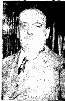
O sr. Sousa Costa, ministro da Fazenda