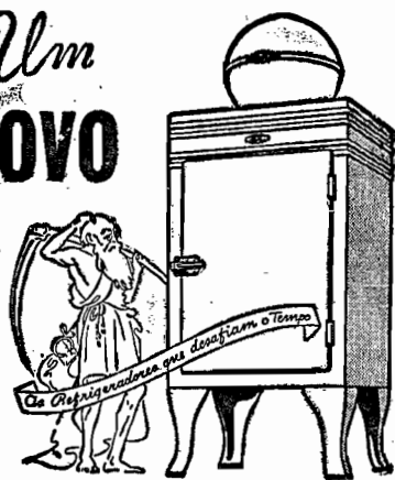
Refrigerador X-1 - durabilidade, economia, elegancia e conforto.