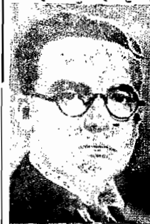
O sr. Odilon Braga, Ministro da Agricultura

A propósito do encerramento da conferência dos Secretarios da Agricultura, o sr.