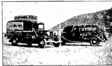
Pratica e elegante infantiva dos progressistas agentes Ford em Santos, Sora Mello & Cia. Ltda. e Oficina Mechanic Ambulante, como se vê acima, auxilia rápida e efficientemente motoristas, em apuros. Sob a direção de um mechanico especializado, cruza, aos domingos e feriados, pelas praias, jardins e demais lugares da sua vizinhança, pronta a prestar quaisquer socorros de emergência.