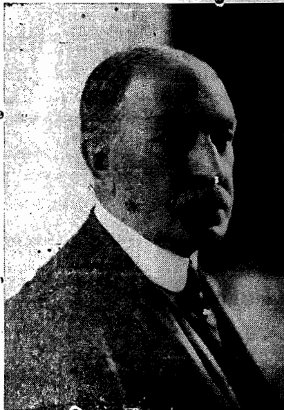
O senador Vidal Ramos

Autoriza o Governo a abrir o credito especial equivalente a réis ouro 2.782.712.869,2, para atender à construção do porto de São Francisco do Sul, no Estado de Santa Catarina.