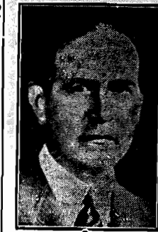
O sr. Oswaldo Aranha