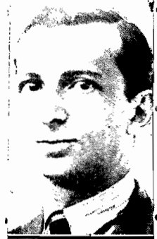
O ministro Vicente Ráo

RIO, (via aérea)—O sr. Vicente Ráo, declarando inaugurado o Curso de Preparatórios de Serviços Sociais, traça desde logo o papel do Estado nas sociedades modernas, mo-