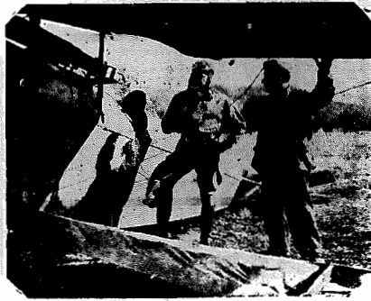
Ganhara a fama de heroe porque abatera trinta inimigos