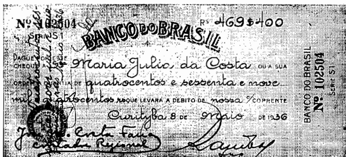
Fac-Símile do cheque emitido a favor da beneficiária. A quantia correspondente ao periodo afreado de 22 de Outubro de 1935 a 30 de Abril do corrente ano

As aposentadorias, pensóes já concedidas, abrangem um indice que, em proporçáo ao numero de associados já in crtos, demonstra cabalmente o que será o Instituto dos Comerciarjos em futuro proximo. A assisténcia medica, jurídica, dentária, auxilio á maternidade e a Carteira de Emprestimos, serão em breve uma realidade, trazendo como desideravel de beneficios á numerosa classe.