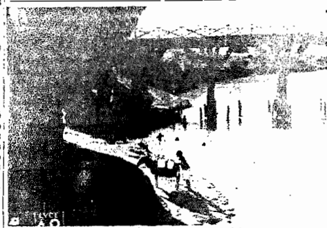
A obra dos italianos no Abissinia

ram um trem, matando três soldados japoneses e dez viagem. Estas noticias causa- ram em Toquio profunda im- pressão e geral indignação. Assegura-se nos meios com- petentes que o governo japo- nês vai iniciar uma campanha decisiva contra os bandidos na Mandchuria.