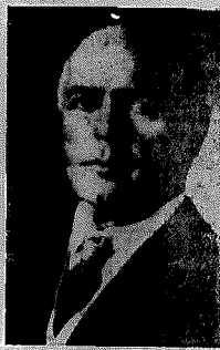
O sr. Gabriel Terra, presidente da Uruguai

situação interna da America. Por essa proposta, é claro que não se conta mais com a