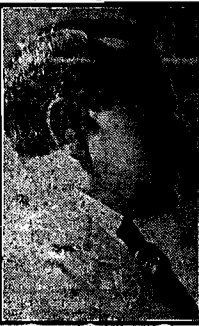
O sr. Getúlio Vargas, presidente do Brasil

BERLIM, 14 (via aérea) — Em artigo intitulado «Paz americana», o jornal «Correspondent»