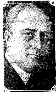
O sr. Roosevelt, presidente dos Estados Unidos

O fato de ter o continente Americano conseguido desenvolver sua obra de paz unicamente porque não perdiam as leis fundamentais da estima reciproca e da igualdade de direitos — esse fato deveria constituir para a Europa um estimulo e um exemplo, afim de que voltasse, no seu lado, às verdadeiras bases de uma vida comum pacifica e próspera fundamente.