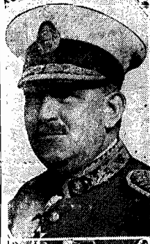
O general Justo, presidente da Argentina

Além disso parece que de certos lados se examina a pos-