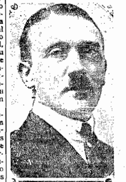
O sr. Hitler Hitler no sentido do que o matrimonio não é um caso indifferente e sim que deve servir para a propagação e preservação da raça.

BERLIM, 9 (via aerea) — A Academia Alemã de Lei terminou a redacção do projeto para a legislação do matrimonio nacional socialista, de accordo com a doutrina pregada por