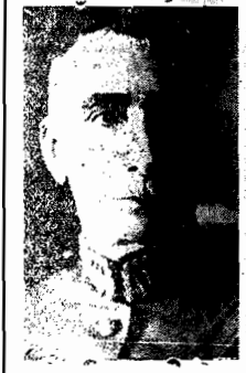
General João Gomes: projetos importantíssimos a serem submetidos à apreciação do Presidente Getúlio Vargas.

RIO, 10 (via aérea) - A propósito da situação da política nacional, O Globo, publica em destaque a seguinte nota: «Sabemos que o ministro da Guerra tem em sua pasta dois