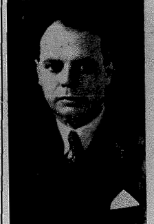
Deputado Renato Barbosa

Dirigida por quem tem se revelado um dos melhores administradores dos municípios do Estado, realizando com poucos recursos, obras de subido valor estético e econômico não só na cidade, como também nos distritos, rasgando ruas, calçando praças, plantando e aformoseando jardins, construindo estradas como a que liga Gravatá ao Braço do Norte, o que deu lugar à instalação do serviço de ônibus da Empresa Darius; a de 13 de Maio à Urussanga Barra; e de Pedras Grandes à Cachoeira Feia no município de Orleans; a de Pinheiral à Braço do Norte; a de Corujas à Rio Bonito e Tubarão a Varzea das Canoas, para citar apenas as principais; já compreendeu há muito que o asfalto é a melhor «toilette» de uma cidade, e foi por isso que os particulares, conjugando os seus esforços com os da administração, plantaram todas as fachadas dos seus edifícios, dando a impressão