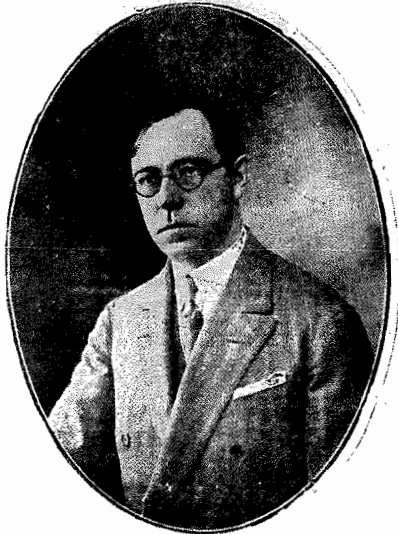
Governador Nerêu Ramos

Os festejos comemorativos do seu centenário, alcançaram um êxito incomum, pelo brilho das solenidades e pela intensidade do júbilo coletivo.