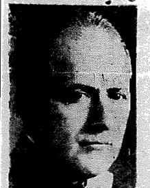
O sr. Lima Cavalcanti, Governador de Pernambuco

RECIFE, 3 (via aérea) — Realizam-se hoje as eleições municipais suplementares nos municípios de Recife, Olinda, Jaboatão, Moreno, Cabo, Itaim.