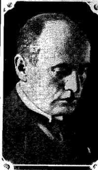
O sr. Benito Mussolini, chefe do Governo Italiano

GENEIRA, 3 (via aérea) — O desenvolvimento do conflito italo-etiope não impede que o sistema de sanções contra a Italia se desenvolva com todas as minúcias da administração.