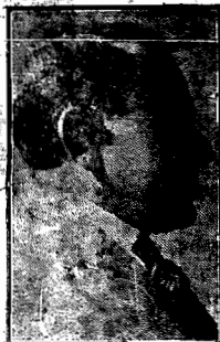
Sr. Getúlio Vargas