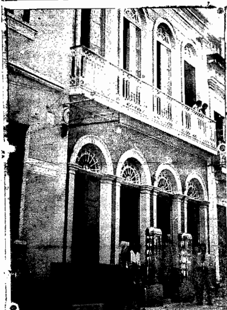
FARMACIA E DROGARIA DA FE - Rua Trajano