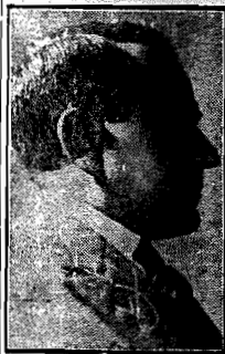
Sr. Getúlio Vargas, Presidente da República

de engrandecimento e embelezamento da nossa terra, junto ao chefe do executivo. Nossa satisfação acumulada se