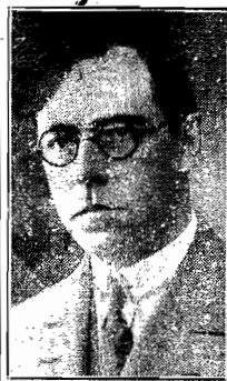
Sr. Nerêu Ramos, Governador do Estado

O jogo, que foi cheio de lances emocionantes, terminou com a vitória do quadro biguassuense, pelo escore do 6 x 0.