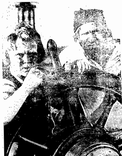
Cena do filme “A Ilha do Tesouro” que o Imperial exhibe domingo

Obedecendo em todos os detalhes á obra em que foi inspirada a famosa “Treasure Island”, de Robert Louis Stevenson. “A Ilha do Tesouro”, apresenta, fielmente, os caracteres do celeberrimo livro de aventuras. E esses caracteres são, na galeria dos artistas de Hollywood, inteiramente fóra do comum. Como filme de aventuras, onde as surpresas se sucedem ininterruptamente, as bizarras criações de Louis Stevenson são reproduzidas no filme com absoluta fidelidade. Long John Silver, a figura que Wallace Beery encarna, jamais foi vista na tela. Representando o perfeito pirata e matreiro, Long John Silver ambicionava a fortuna que um célebre pirata, seu antigo chefe anos antes, deixara oculta numa ilha perdida do Atlantico. Mas, sem meios e recursos de lá chegar, fez-se engajar entre a tripulação de um galeão, como posto de cosinheiro, convencido de que a viagem desse veleiro tinha elevações com o cobizado tesouro escondido. Succedem-se nessa viagem, coisas curiosas, que fazem da figura desse cosinheiro, esse pernetá, um carater de imenso relevo, que só a arte expressionista de Wallace Beery poderia viver.