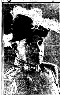
O sr. Protogenes Guimarães, Ministro da Marinha

RIO, 22 (via aérea) - Atendendo a uma solicitação sobre esolorecimentos pedidos pela Camara dos Deputados, com relação a ajuda de custo abonada ao pessoal da Marinha