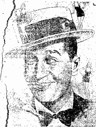
no filme que será um «batatal» sucesso

Azas nas trevas é um filme Paramount, uma das grandes mar- cas dos «Coroados»