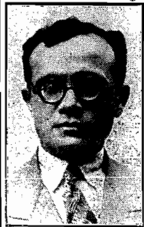
O ministro José Americo

O embaixador Osvaldo Aranha falará de New York e o dr. José Americo do Rio de Janeiro. Ambos os discursos serão irradiados na Hora Nacional, por todas as estações brasileiras.