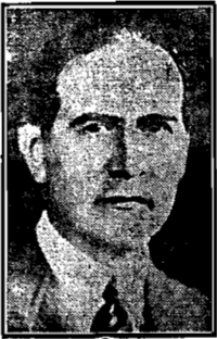
O embaixador Osvaldo Aranha

Falarão hoje, pelo rádio, os srs. Osvaldo Aranha e José Americo